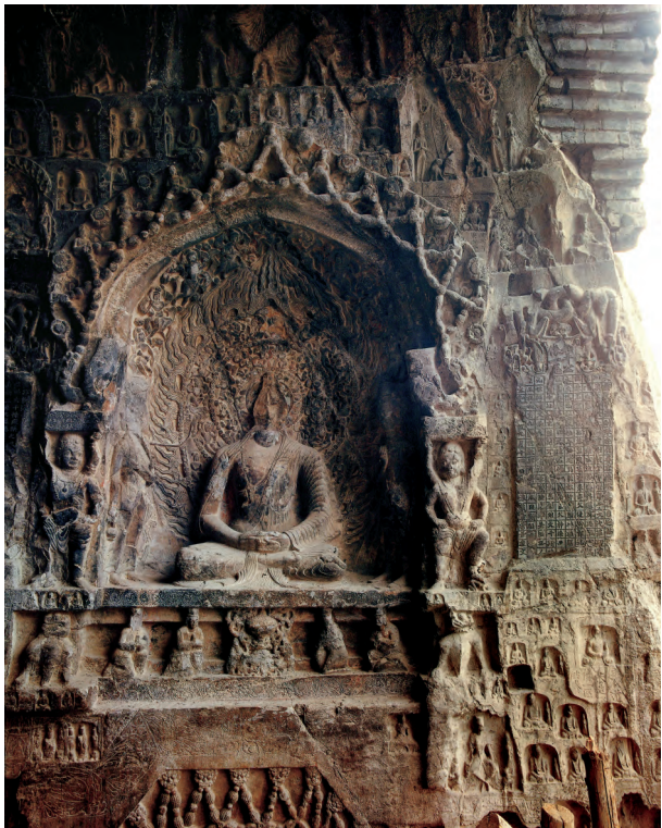
图二 比丘慧成造像龕（出自《古阳洞》第74页，图110）