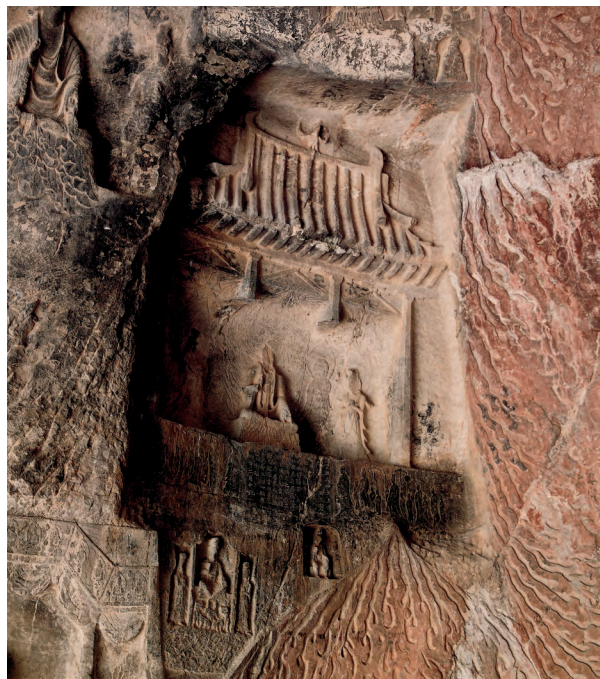
图三 古阳洞W3（出自《古阳洞》第19页，图19）

更为重要的是，与W3相对的W39可能也是安定王龕的一部分。（图四）W3、W39分别位于左右胁侍菩萨身光上部，二龕皆为直接模仿地面