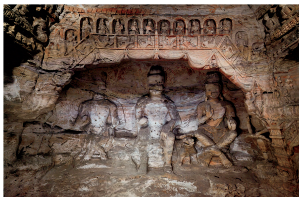
图六 云冈第八窟后壁上层（出自《云冈石窟全集》第六卷，第21页）