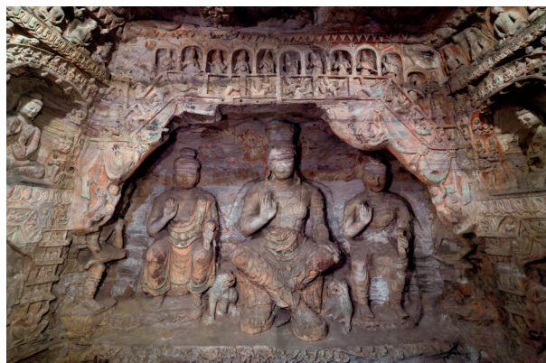
图五 云冈第七窟后壁上层